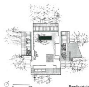
De raadhuis van Sýnýttsalo als raadhuis, Alvar Aalto, 1950.