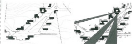
Het oorspronkelijke ontwerp voor de dorpskern. Waar een van de planvormen op de heuvel staat ligt een wigvormige open ruimte. Het raadhuis staat naast de punt van deze ruimte.